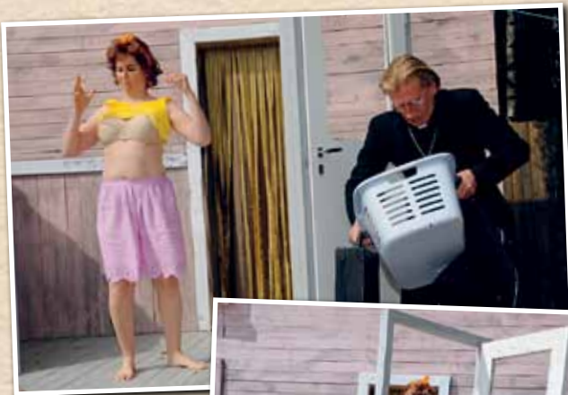
Naapurin rouva pukeutui.

Naapurin rouva toivotti Aimon terve- tulleeksi!