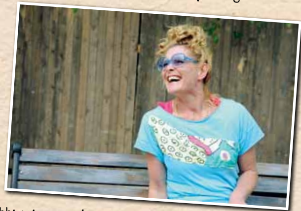
Maikki sai... neuvoja.