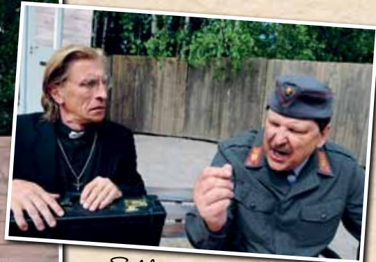
Sotilasmestarillakin oli herkkä puolensa.