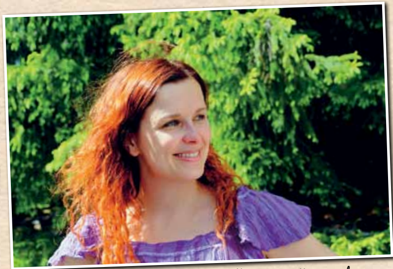
Milla päätti yllättää Aimon.