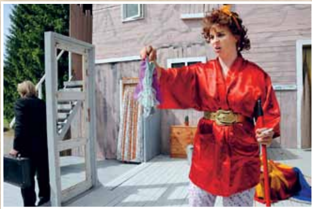
Renlundska siivosi Aimon kodin.